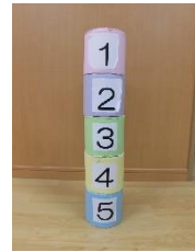
トイレットペーパーつみき