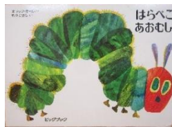
はらぺこあおむし