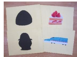
シルエットクイズ

あしぶみ あしぶみ たんたんたん ×2 あしだして あしだして とんとんとん ×2 びよんと とんで びよんと とんで びよんびよんびよん ×2 さようなら♪